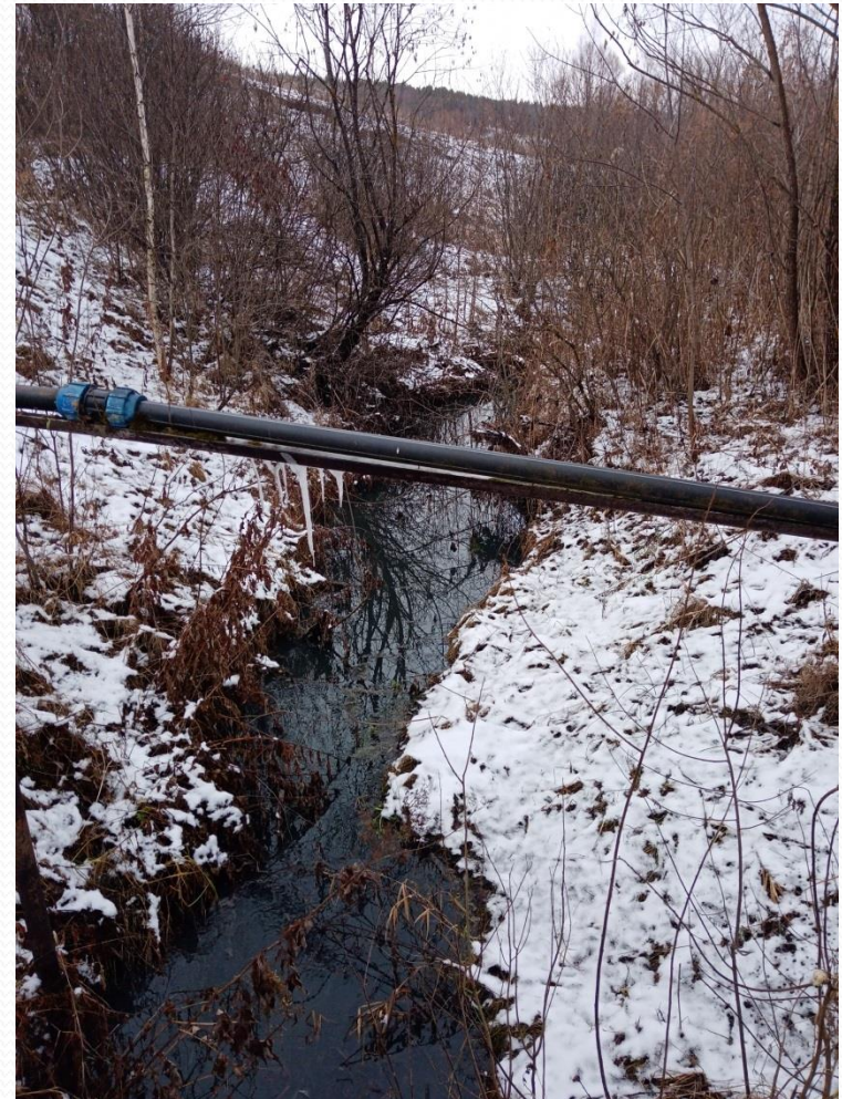
Современный вид водопровода у родника